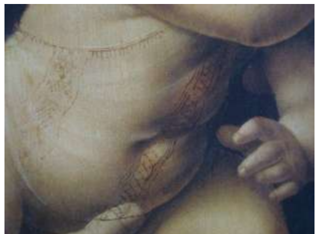
Particolare della Vergine delle rocce di Londra, attribuita a De Predis e Leonardo e a destra il Bambino della Madonna della viola di M.D'Oggiono

Tornando al Salvator Mundi rilevo che è stato completamente ignorato, sul catalogo, l'aspetto relativo ai pigmenti, ai colori di riferimento, alla tecnica delle velature. Infatti si è semplicemente accostato il Salvator Mundi, dal punto di vista tecnico, ad opere come la Gioconda e il S.Giovanni Battista che sono, a mio avviso, più tarde e quindi vi sono certamente delle differenze. Sappiamo per certo che tra periodi diversi le opere di Leonardo presentano in radiografia diversità rispetto all'utilizzo delle tecniche e delle preparazioni, ma tutto ciò non è stato sufficientemente documentato sul catalogo della mostra.