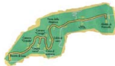
(Mappa del percorso archeologico nel Parco)